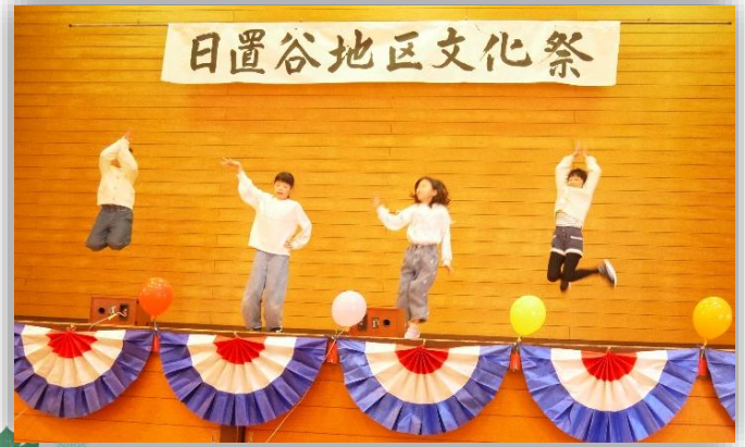
R7.11.9 日置谷地区文化祭

ホームページ: http://chiiki.city.tottori.tottori.jp/hiokidani-1