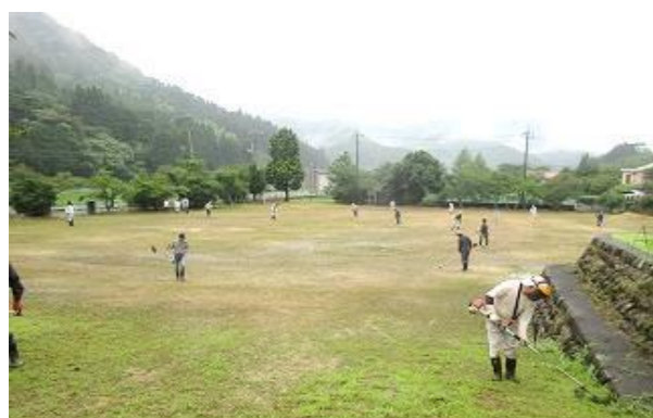
おかげさまできれいになりました

7月14日(日)の納涼祭前の環境整備作業には、多くの方々のご参加をいただきありがとうございました。