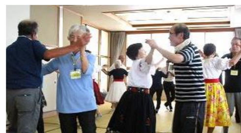
手と手を取り合いダンス♪

福祉部会のところでも紹介していますが、今年も皆様が健康で毎日を過ごせる一助となるよう、『健康づくり講座』が10月12日(土)AM10:00より開催されます。