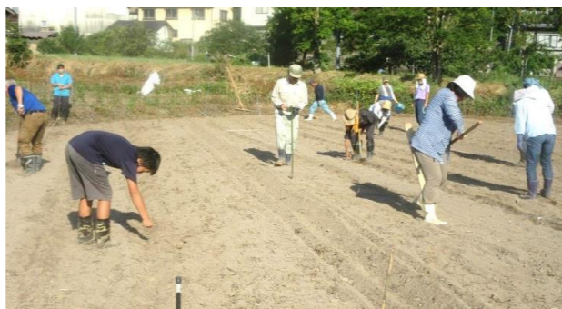
種まきにご協力ありがとうございました

8月11日(日) 朝7時より、盆前の忙しい時、また暑いさなかでの作業に地域の多くの皆さまに応援頂き、そばの種まきを行いました。今回良いと思われる「すじ蒔き」を80cm間隔で一列に蒔き、土をかぶせて約1時間かけて蒔き終わりました。汗をかきながらも上手く1列に蒔けたかなとか、今年の出来具合の心配、収穫祭での新そばが食べれるかな等の話題で盛り上がりました。