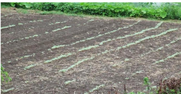
今後の成長が楽しみです

8月15日 台風の心配もありそば畑に行くと、ところどころ曲がってはいるものの、ほぼ一列ごとにかすかに芽吹いており、まずは一安心です。