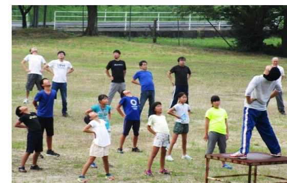
固い身体がほぐれて気持ちいい!