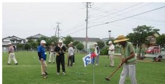
楽しみながらも熱い闘い

さて、いま日置が直面している課題が人口減少とそれに伴う空家の増加です。平成30年度調査で高齢化率が44.3%、344世帯と人口1,000人をきりました。若者を導くイベント計画等、今から考えておくべきではないでしょうか。