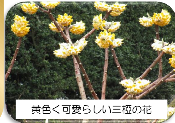
黄色く可愛らしい三桧の花