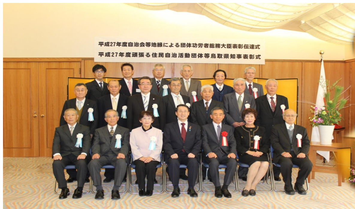
受賞者全員で記念写真(知事公邸にて)