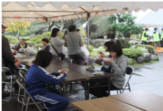
収穫祭そばの振る舞い