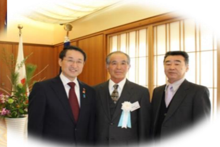
平井知事と記念写真