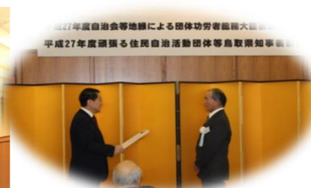
平井知事より表彰状を受ける