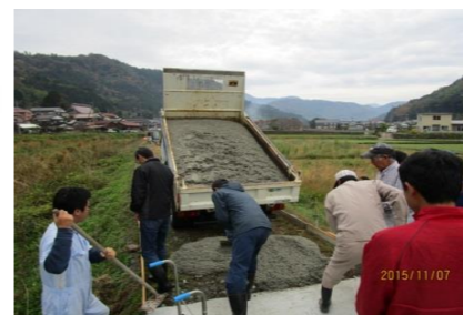
山根散歩道舗装整備の様子