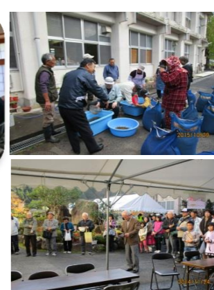
そばの実洗い・そば打ち体験・収穫祭