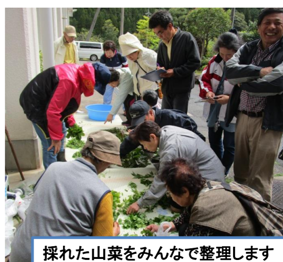
採れた山菜をみんなで整理します