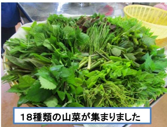
18種類の山菜が集まりました