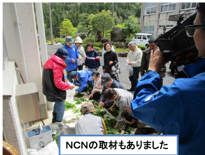
NCNの取材もありました