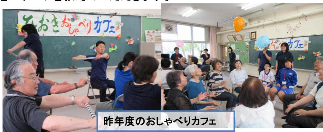
昨年度のおしゃべりカフェ

今回は、青谷福祉会『なりすな』の皆さんに健康づくりの指導や軽スポーツを教えていただきます。