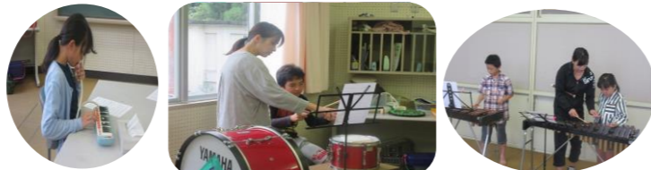
9/21 (土) わしの子楽団