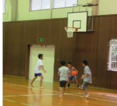
9/18 (水) 体育館で遊ぼう!