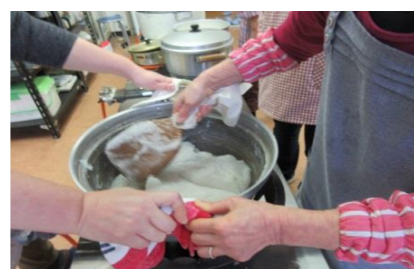
平成30年12月27日 餅・こんにゃく作り