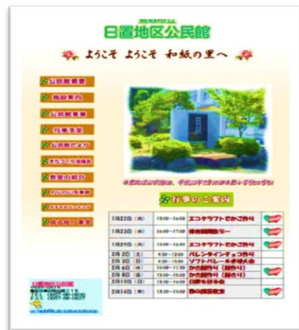
公民館ホームページトップ画面