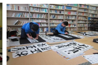
平成30年12月28日 わしのご習字教室・年末大掃除