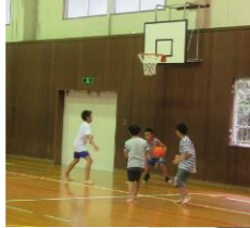
9/18 (水) 体育館で遊ぼう!