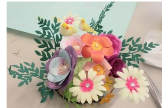
これが完成した作品です お見事!