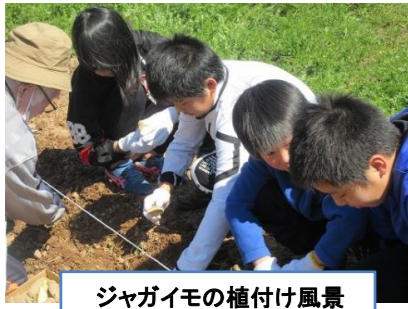
ジャガイモの植付け風景

まだまだ制約が多く中止や延期を余儀なくされる事業等がある中ですが、皆様のご協力で日置地区公民館を盛り上げていただきますようお願いいたします。