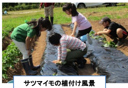
サツマイモの植付け風景