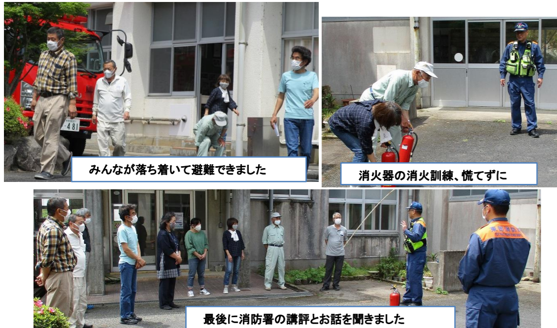
みんなが落ち着いて避難できました

日置地区の有志にも参加をもらって、恒例の避難訓練と消火器での消火訓練を行いました。東部広域青谷出張所の指導を受け、大変勉強になりました。