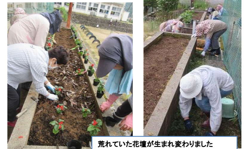
荒れていた花壇が生まれ変わりました