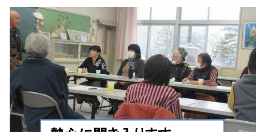
熱心に聞き入ります