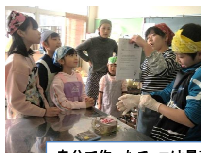
自分で作ったチョコは最高に美味しいネ

バレンタインデーの前に、公民館職員の指導で子どもたちを中心にチョコ作りをしました。なかなかのできればえです。あのチョコは誰にあげたかな？