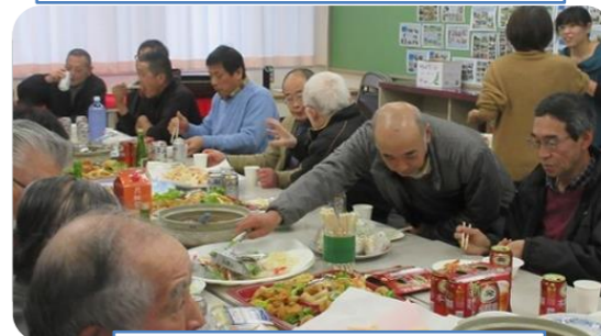
懇親会も盛り上がりしました