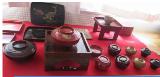
山根漆器を展示してもらいました