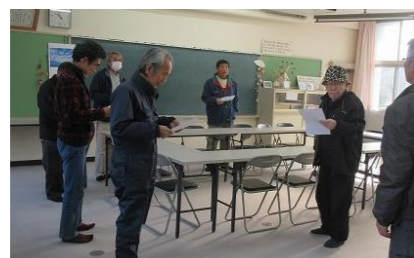
有志の皆さんにも協力いただきました