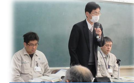
総合支所の交通機関の現状説明