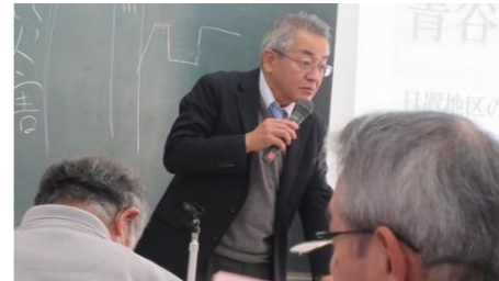
金田市議の市政報告