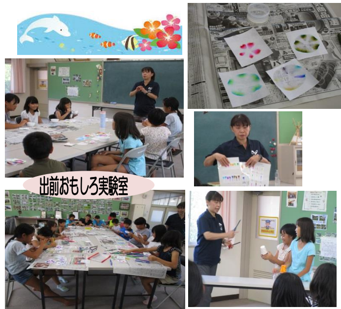
出前おもしろ実験室