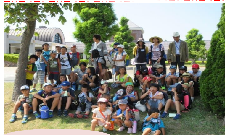
日置・日置谷合同バスツアー