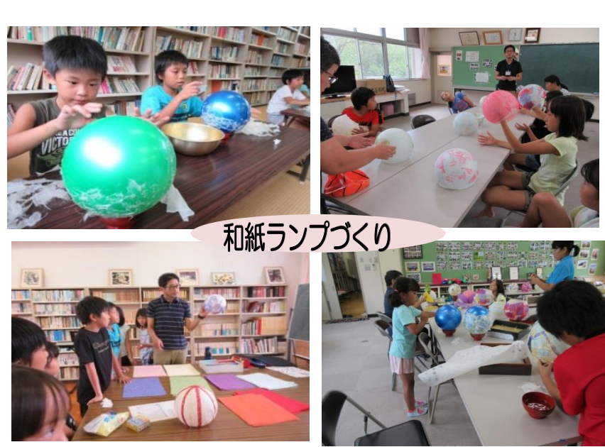
和紙ランプづくり