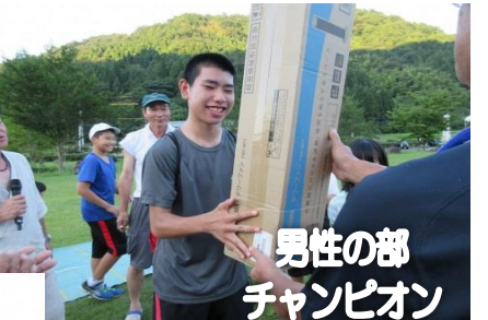
男性の部 チャンピオン