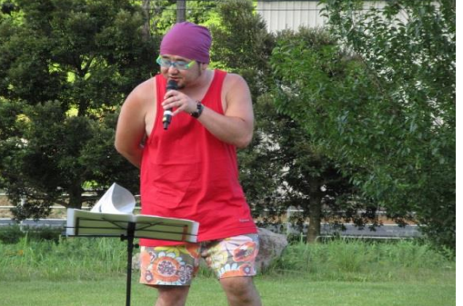
ウナとカマタニバンド