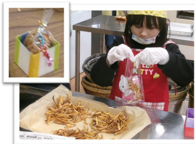
わしの子農園で育てたさつまいもで作った芋もけんぴ 牛乳パックと和紙で作った入れ物