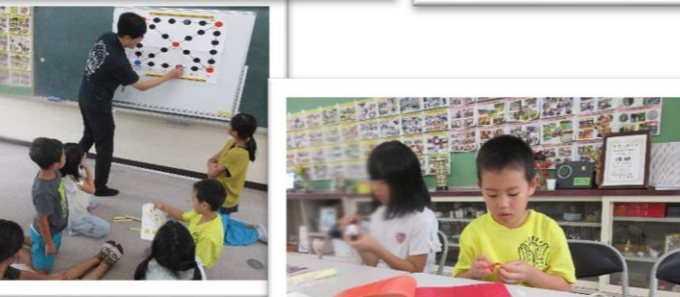
動物マグネット作り