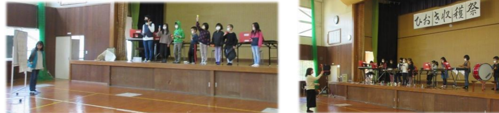
11月6日ステージ発表本番