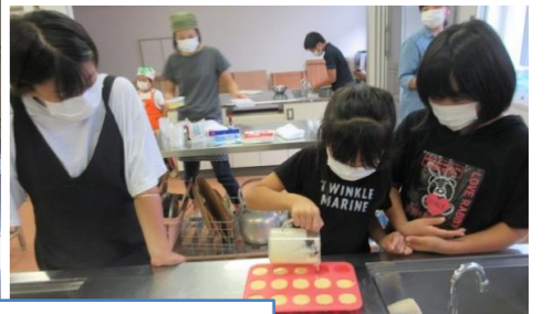
珍しいスイーツに興味しんしん！みんな真剣に取り組んでいます！