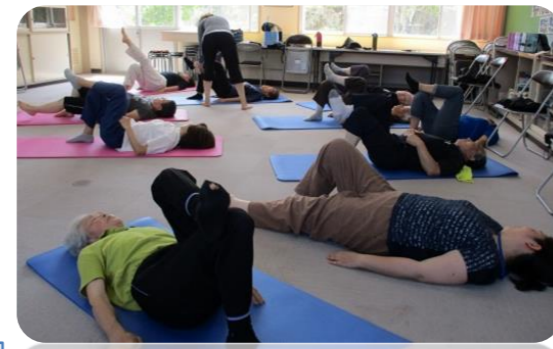
体がついて行かない！うーん