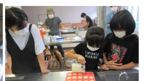
珍しいスイーツに興味しんしん！みんな真剣に取り組んでいます！

午前は「棚田大先生の楽書教室」、午後は公民館職員の指導のもとで「サイエンススイーツ教室」を開きました。今回は、科学の力で”溶けないアイス”作りに挑戦しました。溶けない秘密は〇〇を入れること。時間がたっても溶けない、バニラ風アイスが完成しました！おいしい、食感もいろいろ楽しんでおもしろいです！！