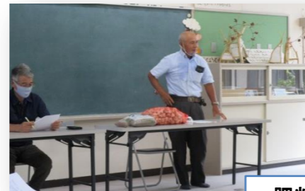
肥料や植え時期、土作りなど学ぶことがいっぱいです