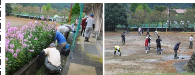
短時間で花壇らしくなりました 連日の雨に相当ぬかるんでいました

暑い中の草刈りをありがとうございました。又、後日体育会がグラウンドの土入れを行いました。応急整備された中で運動会を盛大に行うことができました。ありがとうございました。