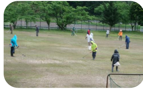
グラウンドの草刈り