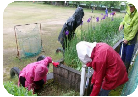
体育館横花壇の整備

小雨の降る中でしたが総勢56名と多くの皆様にご協力いただき、事故もなく終わることができました。ありがとうございました。