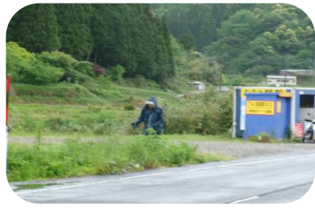
資源回収ボックス周辺の草刈り