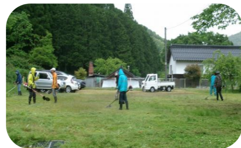
保育所跡地の草刈り