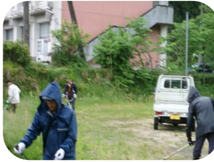
わしの子農園周囲の草刈り