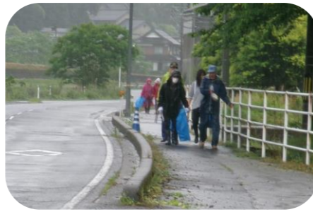
県道沿いの空き缶、ゴミ拾い