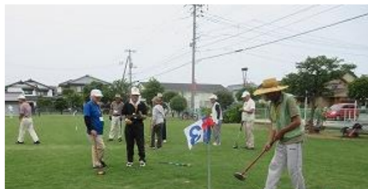
楽しみながらも熱い闘い

さて、いま日置が直面している課題が人口減少とそれに伴う空家の増加です。平成30年度調査で高齢化率が44.3%、344世帯と人口1000人をきりました。若者を導くイベント計画等、今から考えておくべきではないでしょうか。