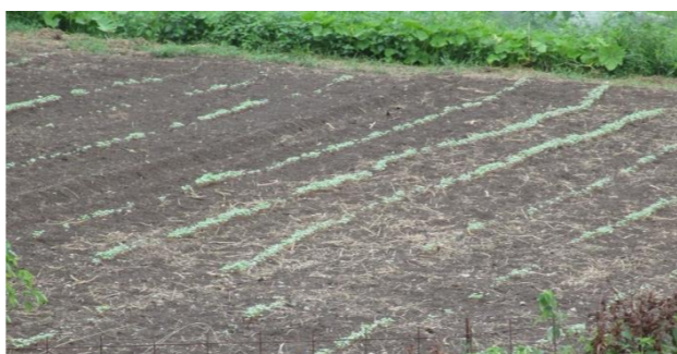
今後の成長が楽しみです

8月15日 台風の心配もありそば畑に行くと、ところどころ曲がってはいるものの、ほぼ一列ごとにかすかに芽吹いており、まずは一安心です。