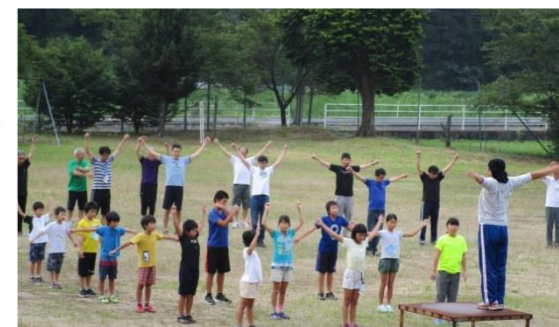
固い身体がほぐれて気持ちいい!