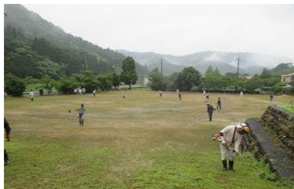
おかげさまできれいになりました

7月14日(日)の納涼祭前の環境整備作業には、多くの方々のご参加をいただきありがとうございました。