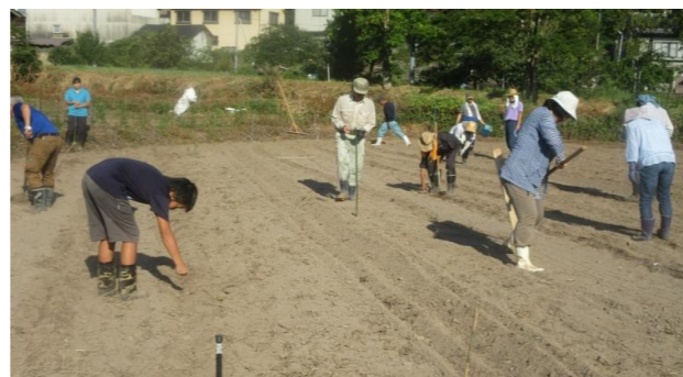
種まきにご協力ありがとうございました

8月11日(日) 朝7時より、盆前の忙しい時、また暑いさなかでの作業に地域の多くの皆さまに応援頂き、そばの種まきを行いました。今回良いと思われる「すじ蒔き」を80cm間隔で一列に蒔き、土をかぶせて約1時間かけて蒔き終わりました。汗をかきながらも上手く1列に蒔けたかなとか、今年の出来具合の心配、収穫祭での新そばが食べれるかな等の話題で盛り上がりました。