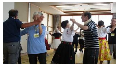
手と手を取り合いダンス♪

ところで今年も皆様が健康で毎日を過ごせる一助となるよう、『健康づくり講座』が10月12日(土)AM10:00より開催されます。