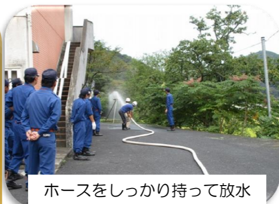
ホースをしっかりと持って放水