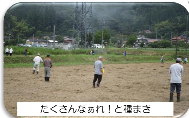
たくさんなあれ！と種まき

特産品部会の取り組みの中で、大きなウエイトを持っているそば作り、ここ2~3年天候不順続きで収穫が激減している。今年度は耕作面積は従来の半分(2反半)ではあるが、汗と知恵を絞りながら100kg以上の収量を目指してみたい。 また、日置の皆さんが食べてみて、「美味しい」これ家でも作ってみたいと思われるような「食」のレシピができ広まれば、ゆくゆくは日置の特産品へと繋がる。そんな料理・お菓子・漬物等の取り組みができれば面白いですね。今特産品部会は、男性がほとんどの活動ですが、これからは女性の力を借りて、幅広い活動をしていけたらと思っています。