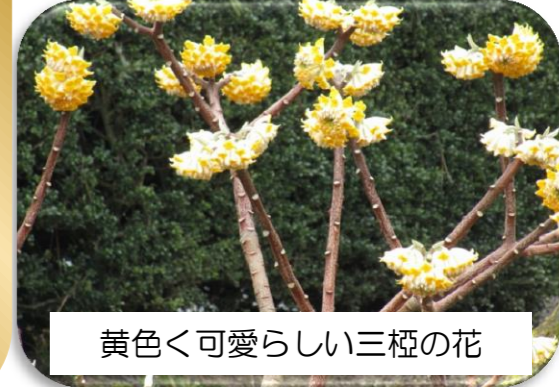
黄色く可愛らしい三桧の花