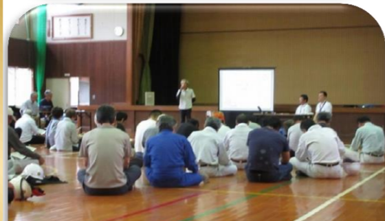
いざという時に備えて防災講習会