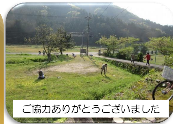
ご協力ありがとうございました