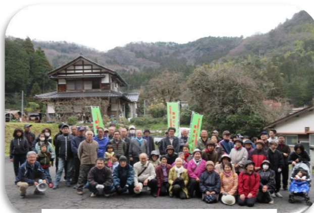
健康づくりウォーキング 小畑にて