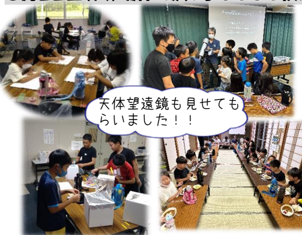
天体望遠鏡も見せてもらいました!!