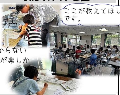
ここが教えてほしいです。