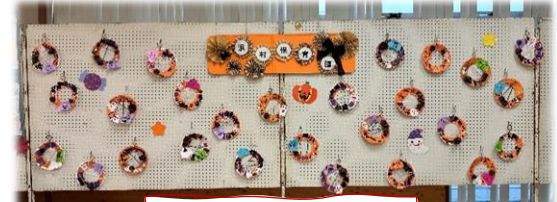
浜村保育園の作品