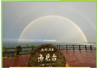
ベストショット賞