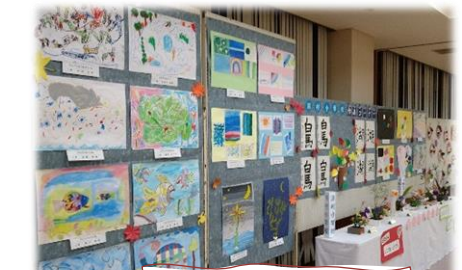
浜村小学校の作品