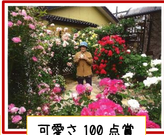
可愛さ 100 点賞