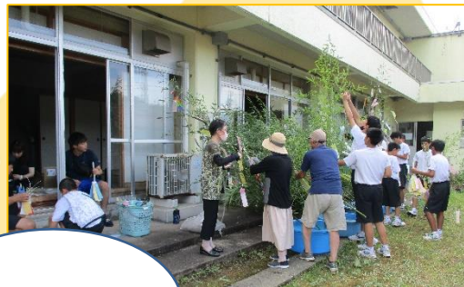
貝がら節と浜村温泉 の活性化事業

来年度は、もっと多くの方と一緒に「まちづくり」を通して、関われることを楽しみにしています。