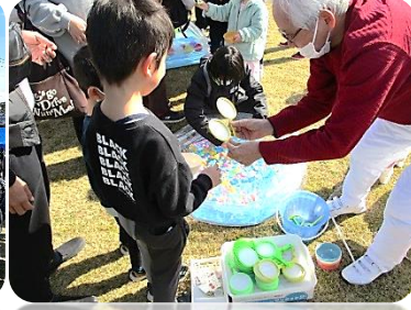
多くの方にお手伝いいただき ありがとうございました。