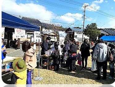
くじ引きにも大行列