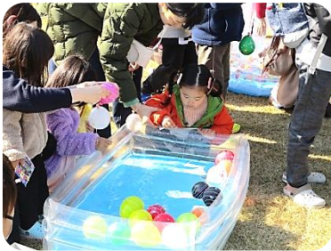
大人気！ヨーヨー釣り

緑日コーナーへもたくさんのご来場ありがとうございました。 久しぶりのフェスタに子ども達の笑顔も見てうれしく思いました。 予想をはるかに超えるご来場に、景品がいき渡らなかつた方もおられて、申し訳ありませんでした。