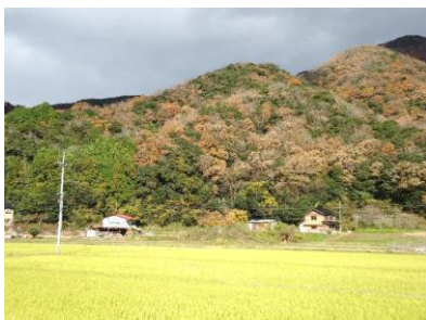
栗谷城遠景(南方から)

このことから文献でも指摘しているように立岩山の背後に所在す「二上山城」の砦としての機能を裏付けるもので、福部平野での人の動向を窺う事と敵の進入をくい止める使命等があったと思われる。