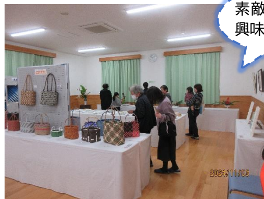
素敵な作品に興味津々!