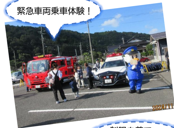
緊急車両乗車体験!