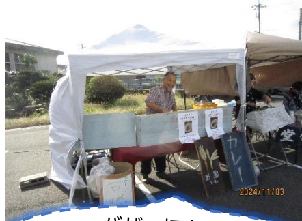
バザー初出店♪ スパイス食堂 杜家さんのカレー