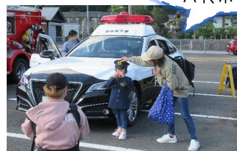
制服を着て、ハイ、ポーズ♪