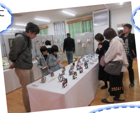
力作揃いの作品展示!