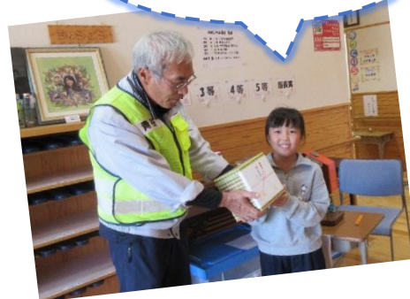
館長賞! 大当たり! おめでとう!