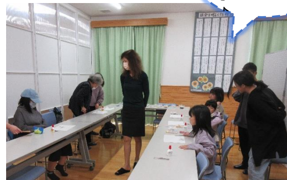
大人気の手づくり工房