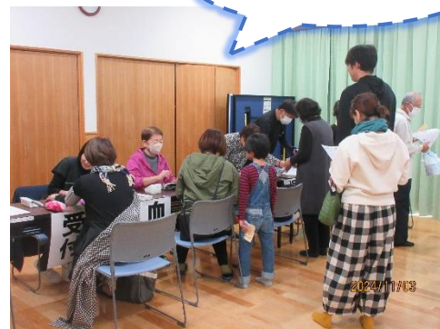
健康コーナー! 皆さん真剣です!