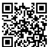
青谷音楽祭クラウドファンディング

巻頭にも書きましたが、青谷のまちをきれいにして、多くの方をお迎えしたいものですね。なお、クラウドファンディングの情報は、右のQRコードから現在の状況が見られます。