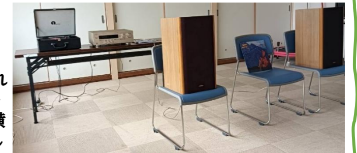
オーディオ機器を揃えていくのも流行りましたね・・・

・去年の夏ごろ、公民館でレコードを聞こうというイベントを考え、チラシも作って公民館に掲示したのですが、館長さん1人しか来られませんでした。それにもめげずに9月の「シニアの集い」でもレコードを流させていただき、さらに今年の3月、「あおや駅横フリマルシェ」でも会場全体に流させていただきました。このとき集まったのが今のメンバーです。