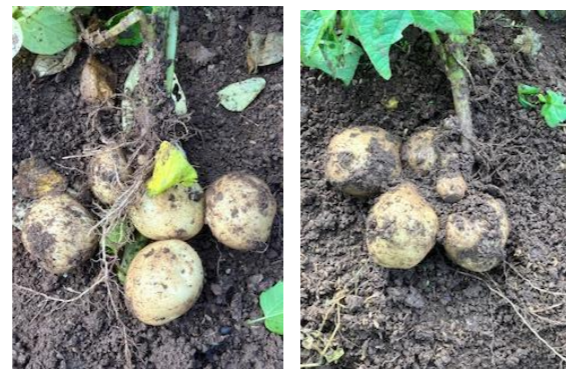
同時に植え、左がマルチなし、右がマルチ有。できはほぼ変わらないが、マルチをした方が早く大きくなった。

尚、私が試しているわけではありませんが、収穫までマルチを張っておくという方法は、植え付けが少し遅かったため、まだ結果が出ていません。来月号で報告できるでしょう。