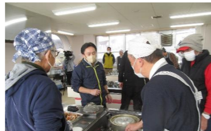
講師も参加者も男性ばかり

公民館では、今困っていること、今後困るだろうと思われることを解決するために、必要なことを実施していきたいと思います。